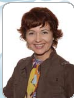
Piše: Tatjana Kalezić

Forex Market je svetsko tržište novca, koje je zabeležilo neverovatan rast u poslednjih 10 godina zahvaljujući, u velikoj meri, tehnološkom razvoju i elektronskom trgovanju. Prosečan dnevni promet ovog tržišta je čak 3,2 triliona dolara. I dok se finansijski servisi utrkuju da, u okviru tržišnih regulativa, ponude što bolje uslove i olakšaju pristup tržištu, samo 10% samostalnih učesnika na ovom tržištu posluje uspešno.